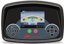
Xe-145F Series Centrifugal Compressor Controller