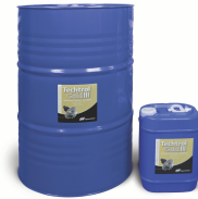
Lubricante Tectrol Gold para los compresores centrífugos