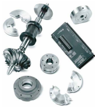
Piezas de repuesto de los compresores centrífugos Centac