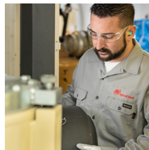
Field Overhaul Services